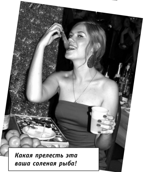
Какая прелесть эта ваша соленая рыба!