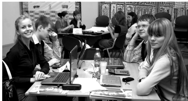
Независимо от достигнутых результатов соревноваться было интересно всем

В полуфинале и финале команды защищали свои идеи относительно стратегии борьбы с компаниями Delta AirLines с низкоценовыми конкурентами. Студентам представилась уникальная возможность применить и