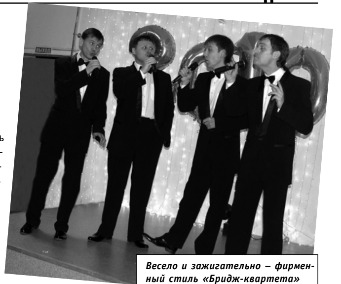
Весело и зажигательно – фирменный стиль «Бридж-квартета»

Короче, вспоминать о том, что было на новогоднем вечере, можно еще очень долго. Но пусть вместо слов помогут вновь погрузиться в некоторые мгновенья сказочной атмосферы феерического праздника фотографии, которые мы решили опубликовать сегодня в «Нашей академии».