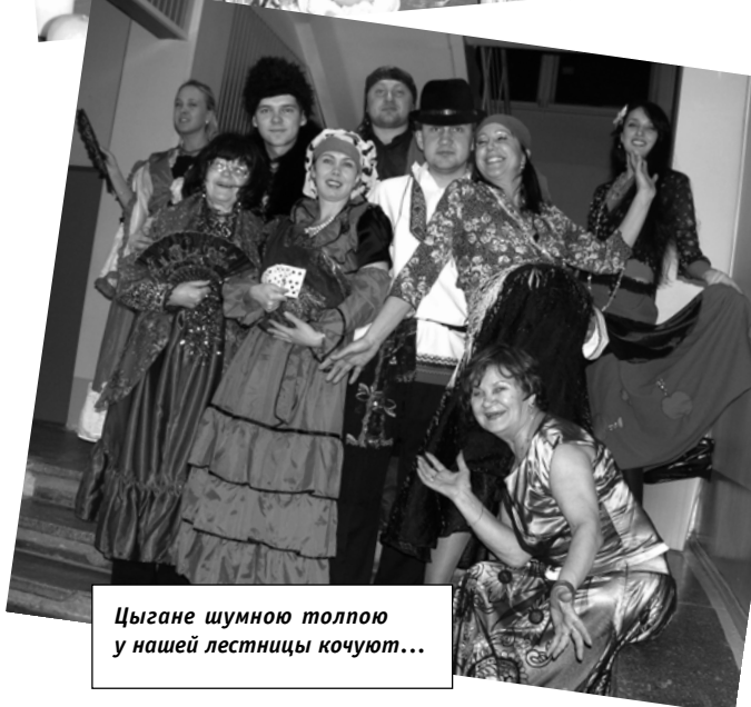
Цыгане шумною толпою у нашей лестницы кочуют...