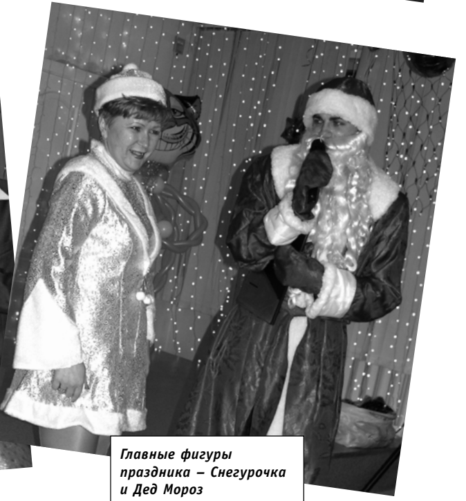
Главные фигуры праздника – Снегурочка и Дед Мороз