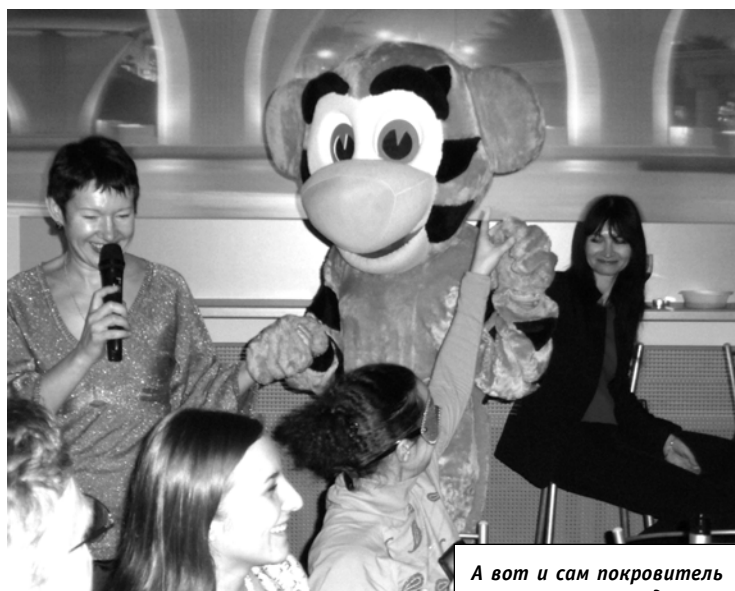
А вот и сам покровитель наступающего года