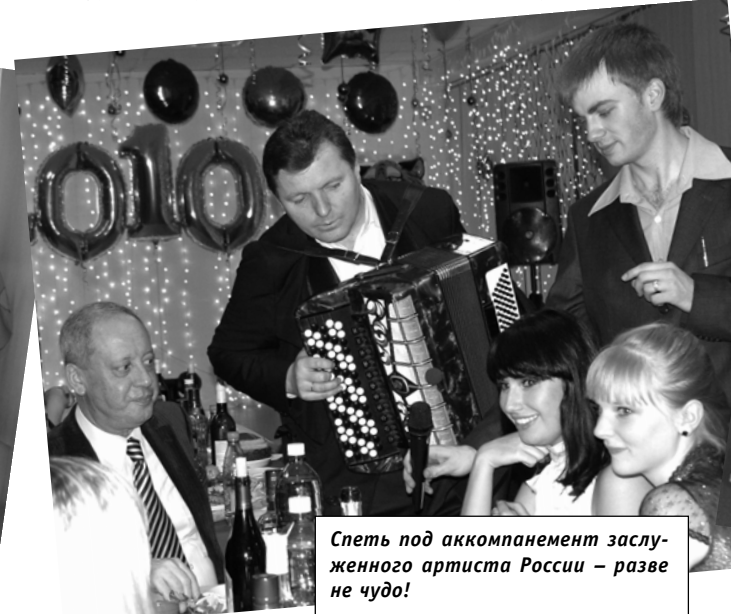
Спеть под аккомпанемент заслуженного артиста России – разве не чудо!