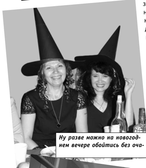
Ну разве можно на новогоднем вечере обойтись без очарования ведьм?

«К сожалению, день рождения только раз в году!» – пели когда-то в эпохальном мультблокбастере Чебурашка и крокодил Гена. Увы, это так! Но еще к большому сожалению (потому что день рождения – это все-таки праздник одного конкретного человека, а новогодние тожества – общий праздник всех и каждого) Новый год тоже бывает только раз в году. А значит, встретить его нужно так, чтобы не было потом мучительно больно за бесцельно упущенные часы безудержного карнавального веселья, невысказанные комплименты, не брошенные как бы невзначай выразительные взгляды, неспетые песни... И тут – уже не к сожалению, а к счастью – нужно сказать, что традиционный новогодний вечер преподавателей и сотрудников «нархоза», в подготовку которого каждый год вкладывают столько старания профком и студклуб, очень даже позволяет все эти возможности не упустить.