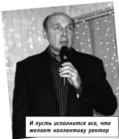
И пусть исполнится все, что желает коллективу ректор

«К сожалению, день рождения только раз в году!» – пели когда-то в эпохальном мультблокбастере Чебурашка и крокодил Гена. Увы, это так! Но еще к большому сожалению (потому что день рождения – это все-таки праздник одного конкретного человека, а новогодние тожества – общий праздник всех и каждого) Новый год тоже бывает только раз в году. А значит, встретить его нужно так, чтобы не было потом мучительно больно за бесцельно упущенные часы безудержного карнавального веселья, невысказанные комплименты, не брошенные как бы невзначай выразительные взгляды, неспетые песни... И тут – уже не к сожалению, а к счастью – нужно сказать, что традиционный новогодний вечер преподавателей и сотрудников «нархоза», в подготовку которого каждый год вкладывают столько старания профком и студклуб, очень даже позволяет все эти возможности не упустить.