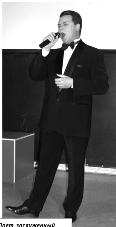
Поэт заслуженный артист Юрий Комов