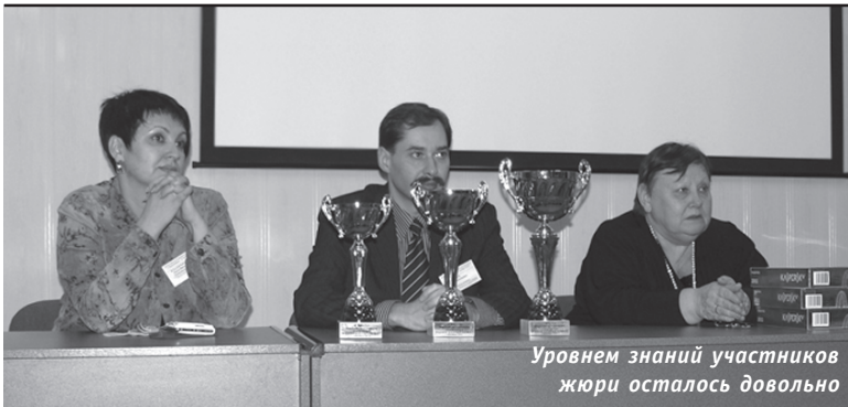
Уровнем знаний участников жюри осталось довольно

В этот день 302-я аудитория третьего корпуса принимала финансовый воротил – акул фондового рынка. Олигархи съехались в НГУЭУ из Москвы, Красноярска, Томска, Барнаула, Екатеринбурга, Перми, Казани, Кирова... Конечно же, среди них были и новосибирцы. Они прибыли к нам, чтобы в духе «гамбургского счета» за закрытыми дверями померяться силами и честно определить: кто же из них самый-самый.