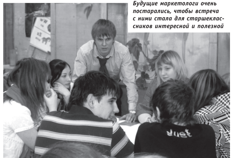
Будущие маркетологи очень постарались, чтобы встреча с ними стала для старшеклассников интересной и полезной