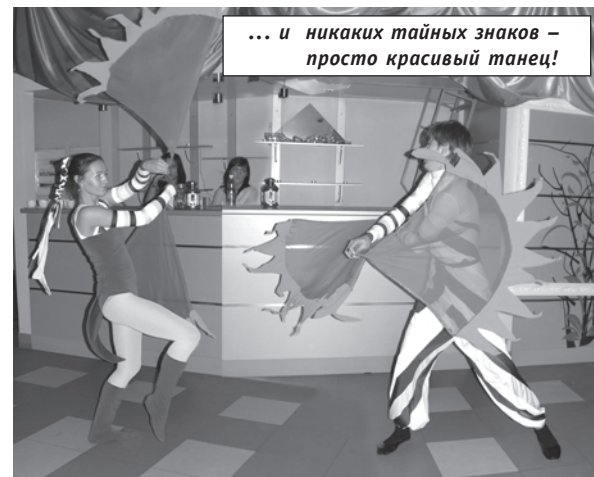
... и никаких тайных знаков – просто красивый танец!

...Наступивший декабрь несет многочисленные заботы и хлопоты, связанные с приближением новогодних праздников. Поэтому двери «Гостиной у ректора» некоторое время останутся закрытыми. Но в январе они распахнутся снова – Юрий Васильевич это пообещал!