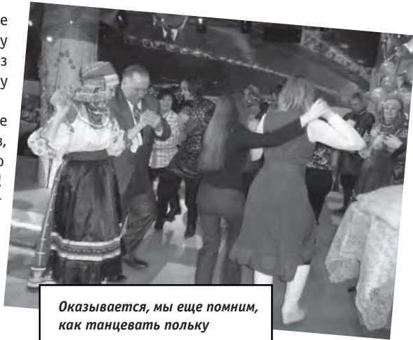
Оказывается, мы еще помним, как танцевать польку

И какой же зимний праздник может обойтись без угощений? В дополнение к яствам и напиткам гостям было предложено продегустировать и отгадать ягоды – размороженные клубнику, сморо-