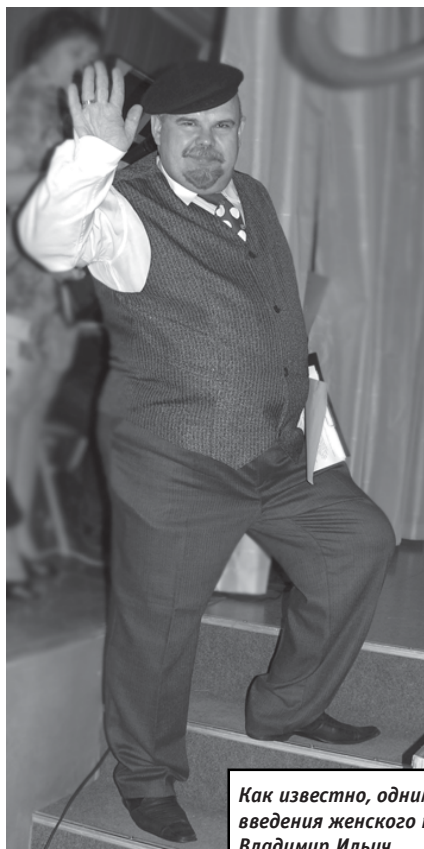
Как известно, одним из инициаторов введения женского праздника был Владимир Ильич