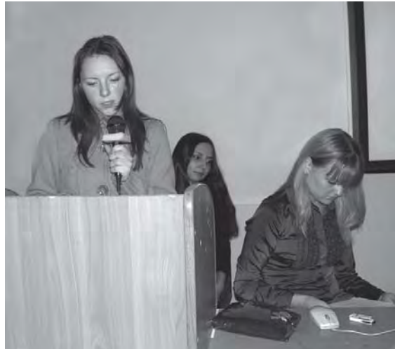
Участницы совещания, посвященного экологии Ини, рассказали о его работе

И вот на заседании эколого-экономического клуба студентки – участницы этого совещания рассказали об основных моментах нынешней ситуации, анализ которой был проведен в Тогучине, а также выводах, сделанных на