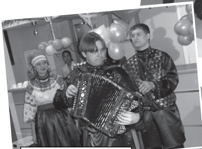
А артисты ансамбля «Рождество» продемонстрировали, что такое настоящий задор и удал