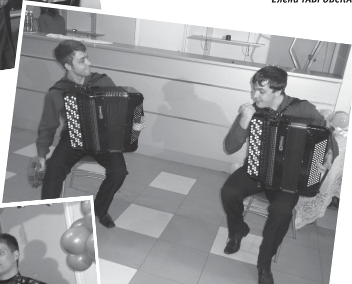
Виртуозным мастерством порадовал гостей Сибирский дуэт баянистов