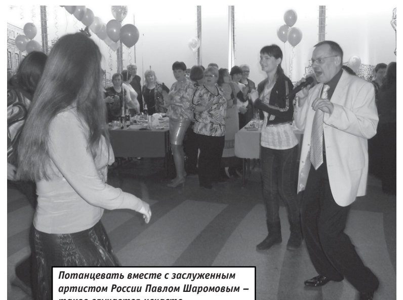
Танцевать вместе с заслуженным артистом России Павлом Шаромовым – такое случается нечасто...