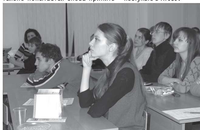
Участники олимпиады слушали выступавших с огромным вниманием

И каждый, кто в следующем году еще будет учиться в школе, обязательно попытается снова принять участие в олимпиаде. А большинство тех, кто школу закончит, придут поступать в НГУЭУ.