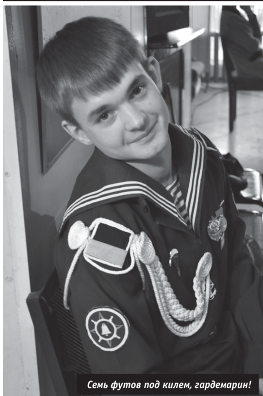
Семь футов под килем, гардемарин!