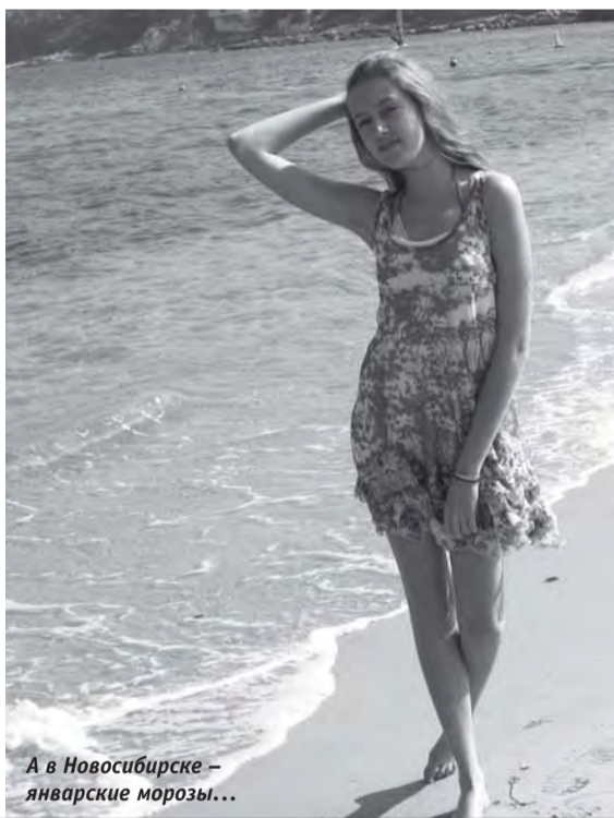
А в Новосибирске – январские морозы...