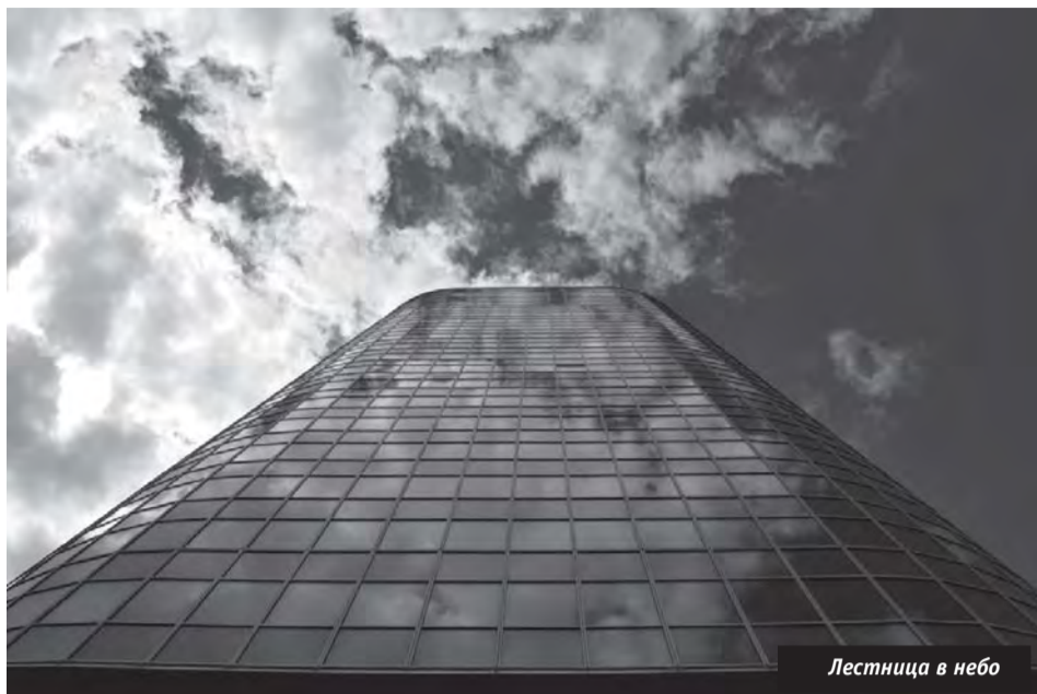
Лестница в небо

Алена любит фотографировать животных. И они у нее очень хорошо получаются. Когда смотришь на такие ее фотографии, кажется, будто собаки, кошки и даже птицы специально позировали ей. Но только она сама знает, сколько времени и терпения требует каждая такая фотография. А еще ей удаются портреты, жанровые снимки, городские пейзажи... Умение найти удачную точку съемки, выбрать неожиданный ракурс, поймать то самое неповторимое мгновение – все это присуще фотоработам Алены. О них можно рассказывать долго. Но зачем лишние слова, когда можно просто посмотреть на эти запечатленные мгновения, пропущенные не только через фотообъектив, но и сквозь душу автора.