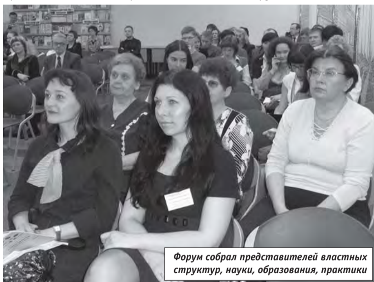
Форум собрал представителей властных структур, науки, образования, практики

Организационный комитет благодарит всех, кто внес свой вклад в проведение форума, и выражает надежду, что в будущем году мероприятие будет не менее представительным. До встречи на пятом, юбилейном форуме!