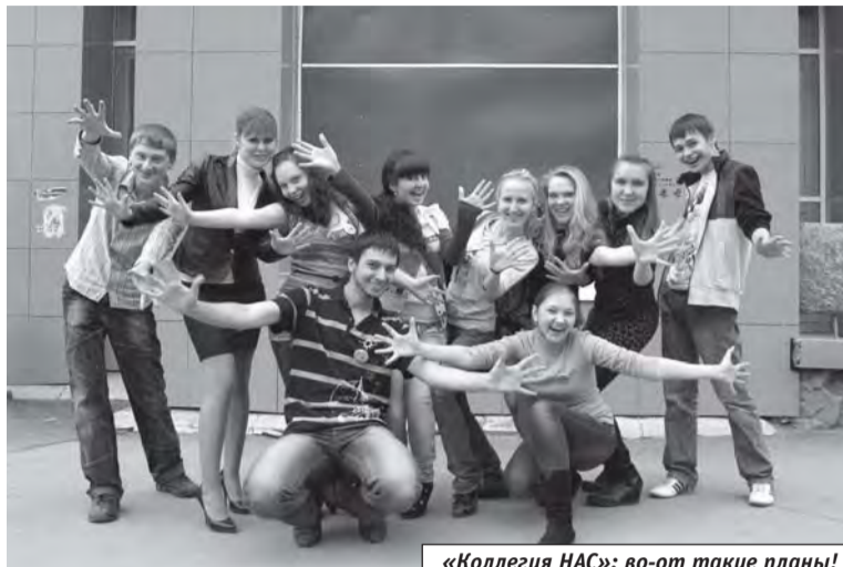
«Коллегия НАС»: во-от такие планы!

традиции, то обнаружили, что нынешние выпускники из группы 6092, которые и были родоначальниками ритуала посвящения первокурсников, сами через это посвящение не прошли. И мы решили, пока они еще не простились со студенческой жизнью, исправить оплошность: организовали для них праздник, окунули в мир первого курса, подарили значки и флажки ИПИ. Можно представить, как обрадовал их этот сюрприз!