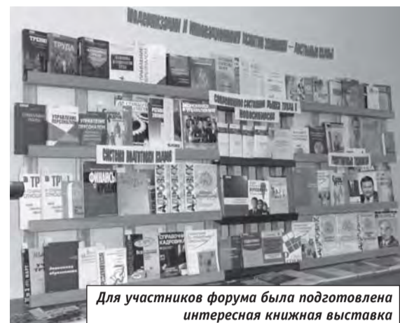
Для участников форума была подготовлена интересная книжная выставка

«Наша академия» продолжает информировать своих читателей о том, как в нашем вузе проходил IV Сибирский кадровый форум. Сегодня мы публикуем завершающий материал, посвященный его центральному событию – конференции «Модернизации и инновационному развитию экономики – достойные кадры».