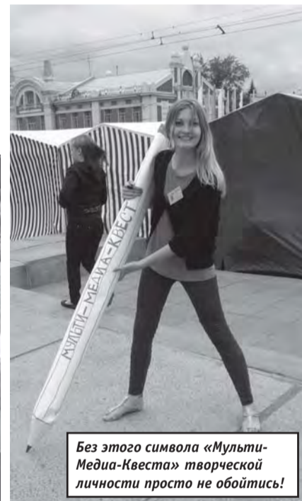
Без этого символа «Мульти-Медиа-Квеста» творческой личности просто не обойтись!