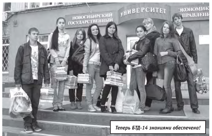
Теперь БТД-14 знаниями обеспечена!