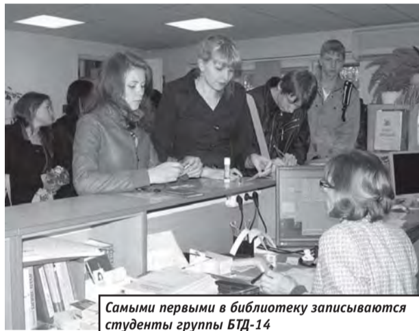
Самыми первыми в библиотеку записываются студенты группы БТД-14

Каждый год в первые недели сентября в первом корпусе и около него можно наблюдать одну и ту же картину: первокурсники, навьюченные туго набитыми книгами сумками и пакетами (при этом все книги туда не помещаются, так что пакеты книг, перевязанных шпагатом, приходится еще нести в руках), расходятся по домам после получения в библиотеке своей первой учебной литературы.