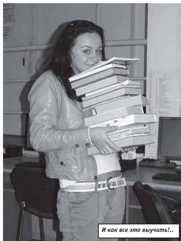
И как все это выучить!..

...Для первой группы хлопоты с получением учебной литературы закончились. Теперь осталось только все это выучить. А библиотекарям остается обслужить 49 групп. Студенты следующей из них – БТД-13 – уже с нетерпением ждут своей очереди в коридоре.