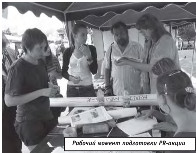
Рабочий момент подготовки PR-акции