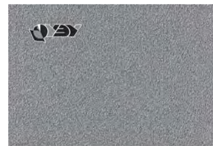
СБОРНИК НАУЧНЫХ ДОКЛАДОВ АСПИРАНТОВ НГУЭУ

Сборник предназначен для студентов экономических специальностей вузов, аспирантов и всех, кто интересуется проблемами экономики, финансов, кредита и банков.