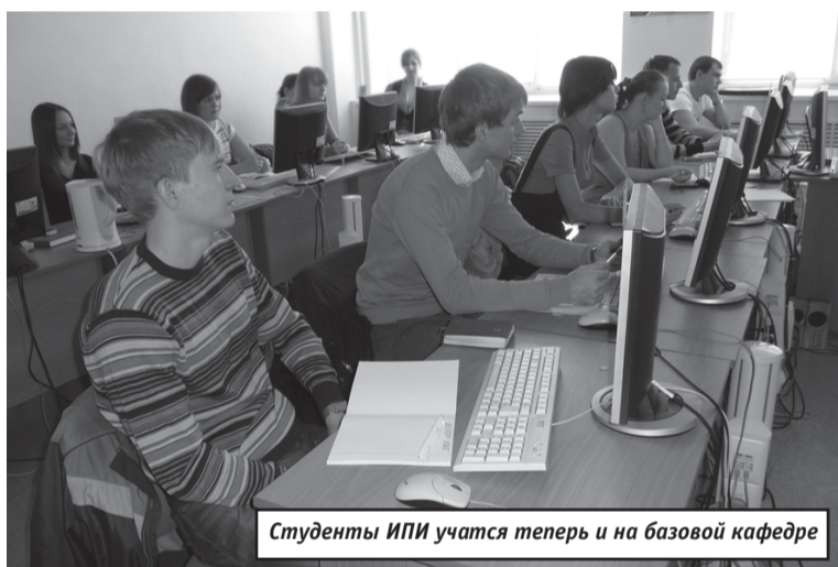
Студенты ИПИ учатся теперь и на базовой кафедре