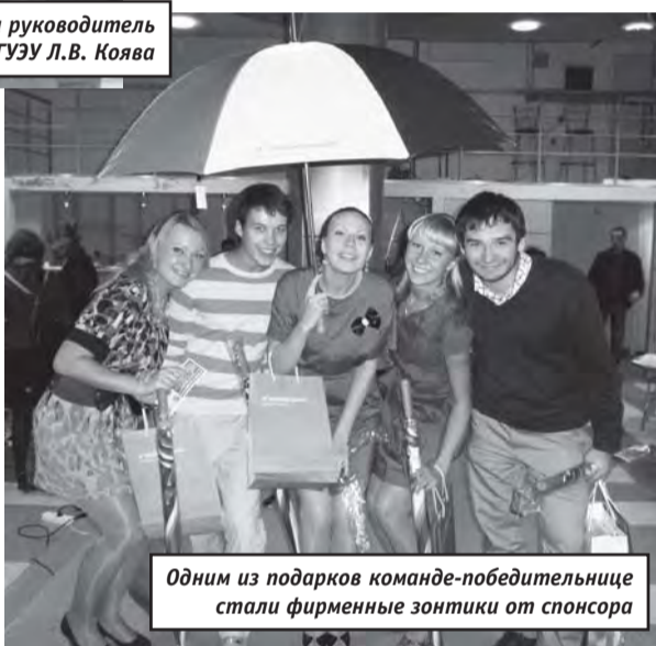
Одним из подарков команде-победительнице стали фирменные зонтики от спонсора