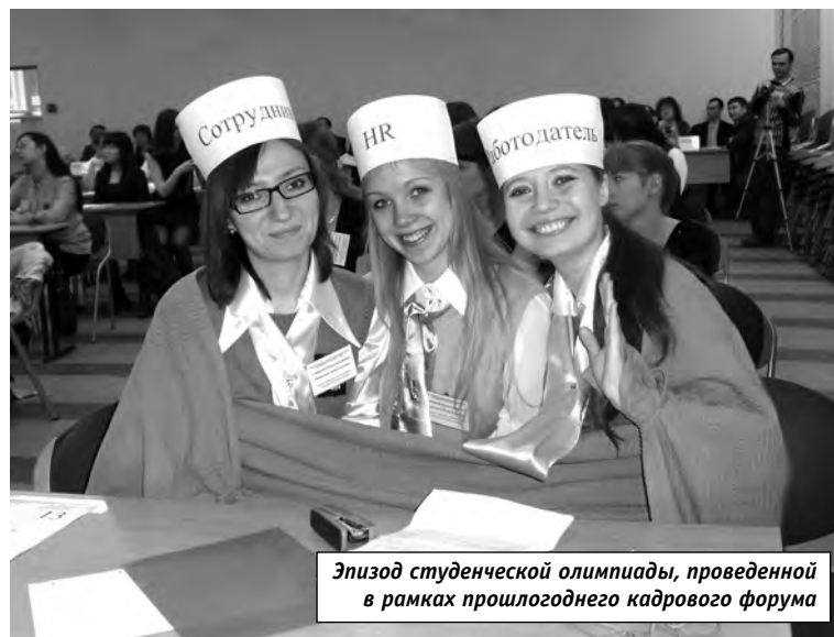
Эпизод студенческой олимпиады, проведенной в рамках прошлогоднего кадрового форума

Активная работа будет протекать в ходе круглого стола «Бизнес и образование: инновационные формы