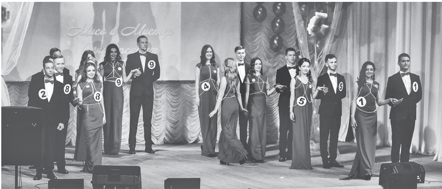
Финал конкурса «Мисс и Мистер НГУЭУ–2016»

вого рынка и финансовых институтов НГУЭУ организовала и с успехом провела две всероссийские олимпиады по дисциплинам «Банковское дело» и «Рынок ценных бумаг», в которых участвовали студенты не только новосибирских вузов, но и вузов Москвы, Санкт-Петербурга, Казани, Кемеровской области, Алтайского края, Омска, Перми.